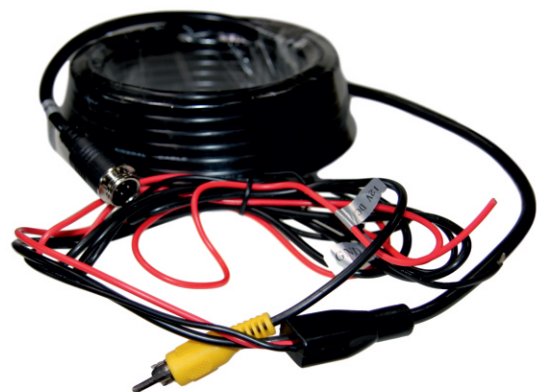
10m Verlängerung mit RCA-Anschluss